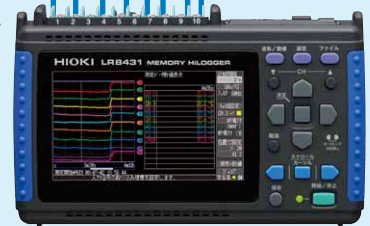
메모리 하이로거 LR8431-20